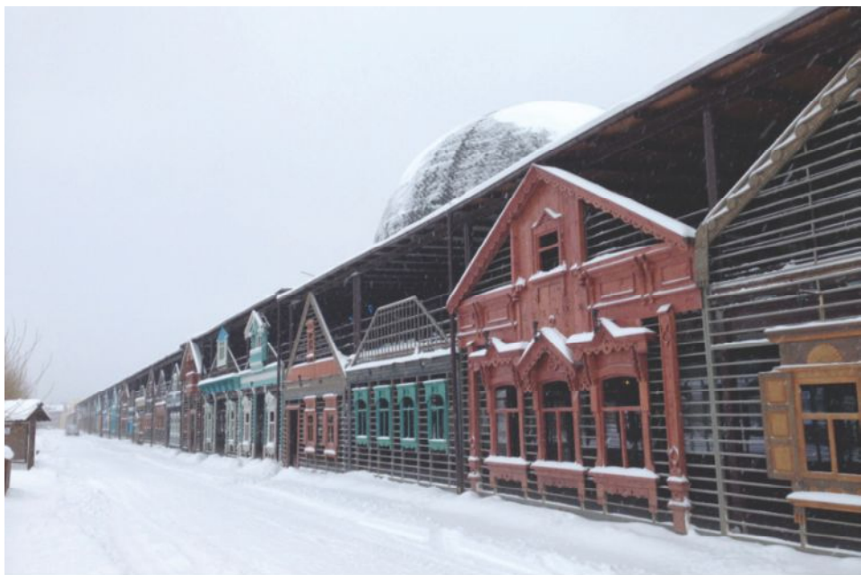
Рис. 4. Поиск национальной идентичности вблизи поселений. Это-мир, Калужская область

Умеет оформлять результаты градостроительного планирования для целей согласования, обсуждения, публич-