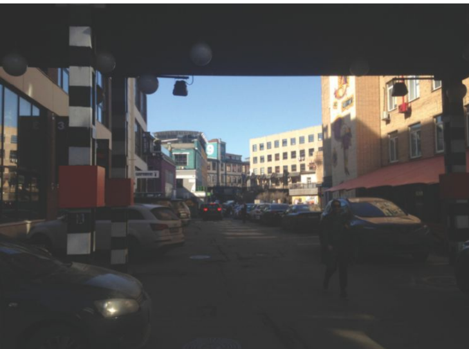
Рис. 2. Многоплановая и изменяющаяся городская среда, тем не менее, является объектом градостроительства

Сложность деятельности – показатель, определяющий требования к умениям и зависящий от следующих особенностей профессиональной деятельности: множественности (вариативности) способов решения профессиональных задач: